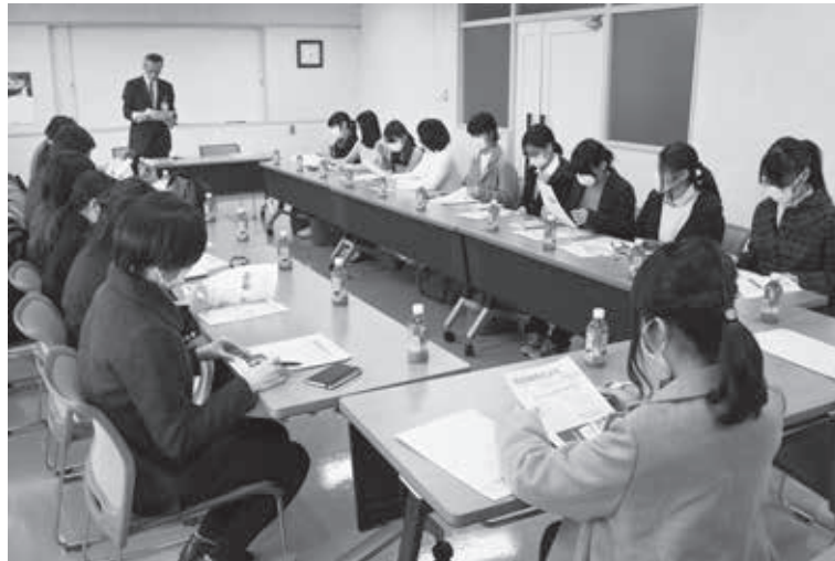
図2 実地調査時の意見交換会