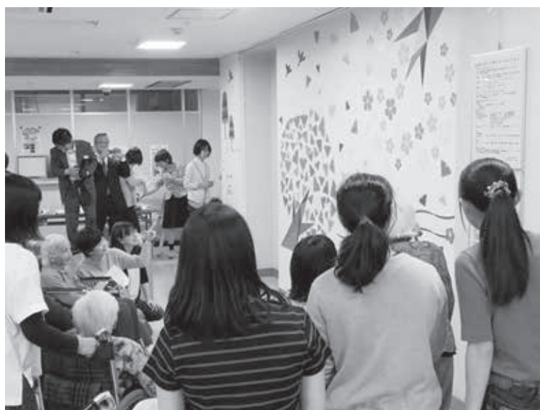
図3 壁面装飾イベント当日の様子