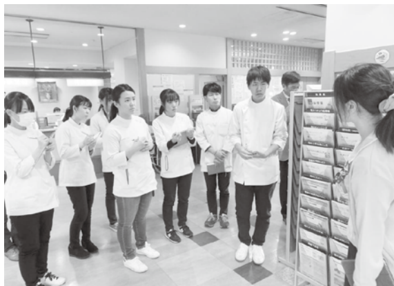
図1 現地調査の様子

調査後は、まず大学において参加学生各自が1案ずつ提案を行い、その後、類似の提案をまとめて5案に絞った。企画案は、院内のアクアリウムから発想を得たA案「魚のいる小窓・波」、殺風景な空間