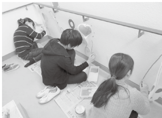
図6 当日の様子2（踊り場のイラスト）