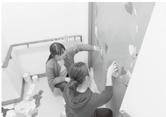
図5 当日の様子1（非常扉のカットニングシートの貼付）