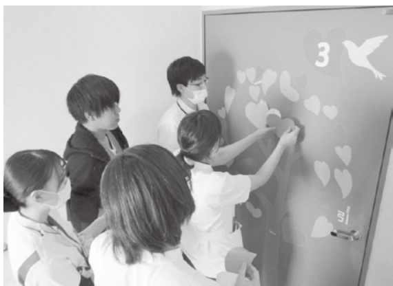
図7 当日の様子3（病院スタッフの参加）