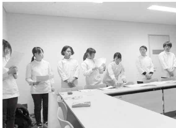
図2 プレゼンテーションの様子

再提案は、病院側からの意見を踏まえマスコットキャラクターの使用や、ロゴマークに使用されているハートをモチーフとしたマグネットシートを作成し、非常階段の扉にはカットニングシートでハートの木を作成し、踊り場に花のイラストを描くというものである(図3)。また、修正案には作業工程も提案した。施行当日に病院スタッフと学生で完成させることでコミュニケーションを取るという方法を採用するため、ハート型のカットニングシートの切り抜きを病院側に依頼した。