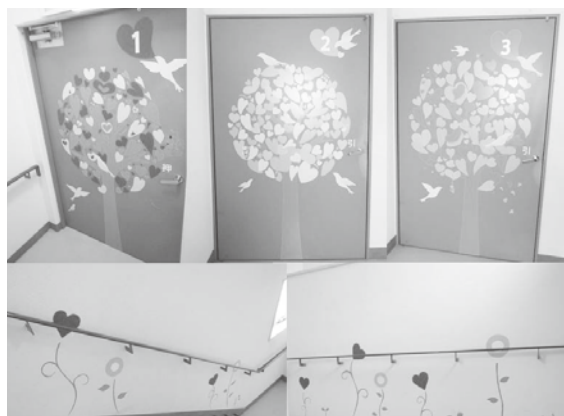
図8 完成した壁面アート 川崎医療福祉大学医療福祉デザイン学科撮影